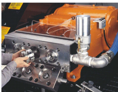
快速更换柱塞液力端，简单、快速、可靠

NLB225系列水泵都可以通过简单快速地更换柱塞或转换套件而使一台水泵可以在不同压力下有不同的水量。